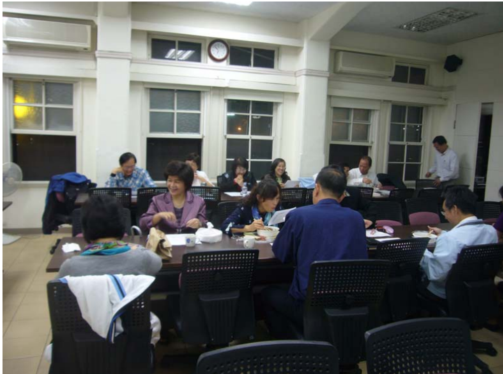
(以下相片是讀書會剪影)