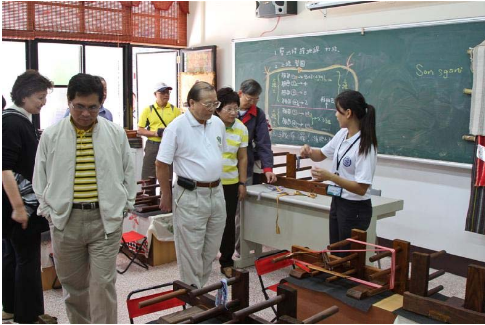
(織布主題教室導覽)