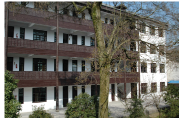
校園一景：環境幽雅，校舍純樸