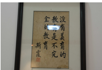
校園處處可見書法作品