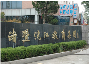
浣江教育集團—浣江校區大門口