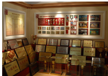
卓越的教育成果—得獎紀錄琳瑯滿目