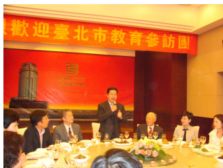
諸暨市委書記王繼崗先生致歡迎辭