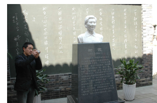
校園一景：傑出校友知名兒童教育 專家-斯霞女士雕像