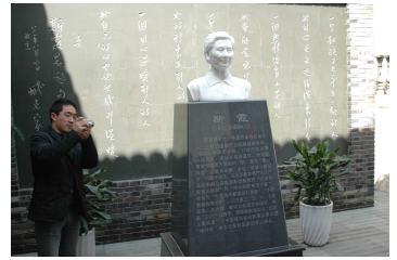
校園一景：傑出校友知名兒童教育專家-斯霞女士雕像