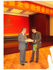
致贈諸暨市委書記王繼崗先生及教育局長吳江輝先生紀念品