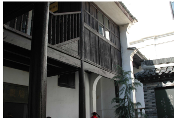
百年名校—古色古香的木建築校舍