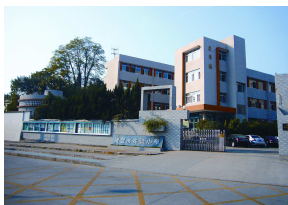
實驗小學發源地（慶同小學）— 1991 年 8 月創辦於諸暨市