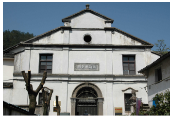
康有為在斯民小學的新校舍題寫「漢斯孝子」祠門額