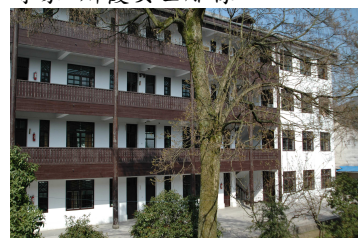
校園一景：環境幽雅，校舍純樸