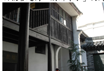
百年名校—古色古香的木建築校舍