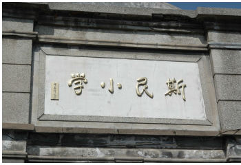
斯民小學大門口牌樓題字