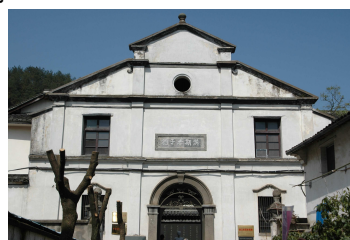
康有為在斯民小學的 新校舍題寫「漢斯孝子」祠門額