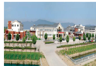
適合學生發展的優質學校—浙江省 諸暨市實驗小學教育集團