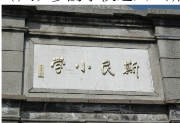
斯民小學大門口牌樓題字