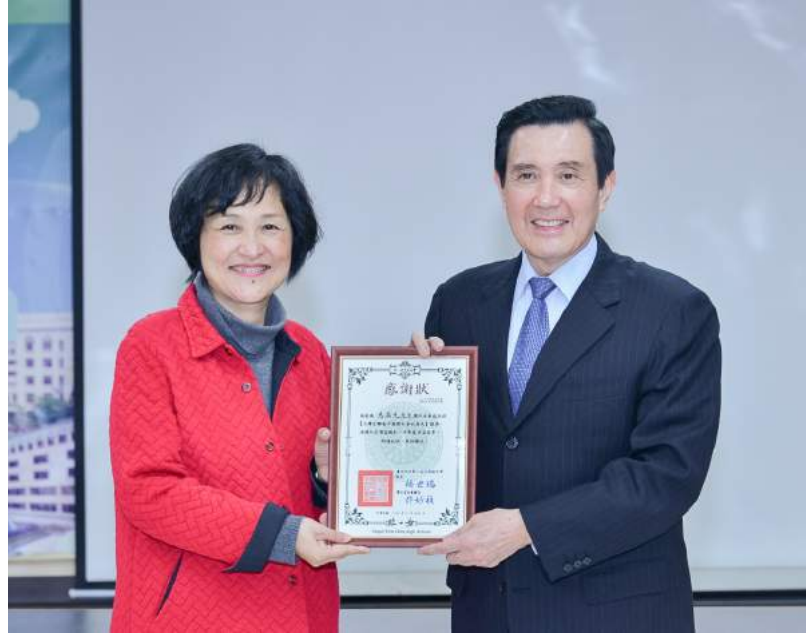
校長頒發感謝狀給馬前總統

這一年的班長任期已經屆滿，從初接任時的徬徨到最後完成任務，一路走來真的要感謝各個幹部努力不懈的付出，更要特別感謝學校、家長會對成長班的肯定與全力支援：校長和會長在開課日的談話勉勵，圖書館齊老師與總務處的設備協助，才能使成長班日益蓬勃發展，學員人數屢創新高；而成長班學員在快樂分享、終身學習之餘，亦以感恩回饋的心協助推動綠園大小事，無私奉獻的精神也令人感佩；能夠在過去一年略盡棉薄之力為成長班服務，更是幸運如我的無上榮幸，感謝綠園、感謝家長會、感謝成長班！！