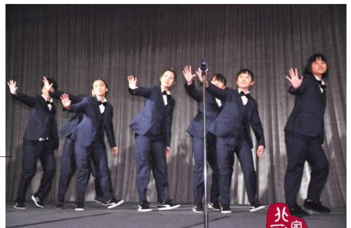
由家長組成的烏克蘭麗表演