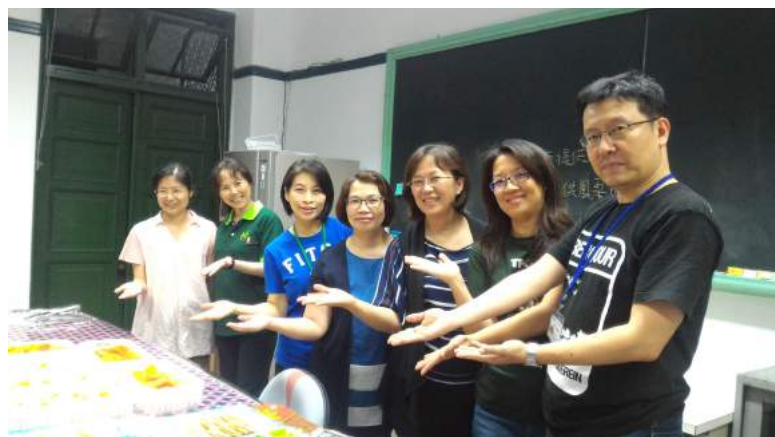
綠洲加油站志工們用滿滿的愛心準備了各種點心和水果