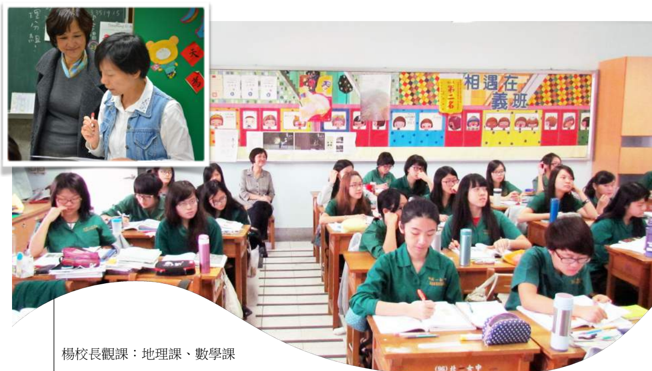
楊校長觀課：地理課、數學課