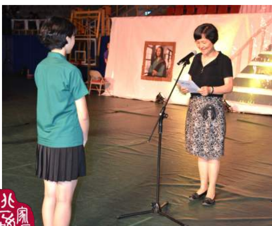
第75屆畢業典禮，頒發畢業證書給畢業生代表

另外，經過老師建議及評估考慮，教務處規劃數理資優班的異地學習與以往不同，減少參訪遊玩、增加學習比重，而且從高二上學期提前到高一下學期辦理。家長們在聽完蔡主任及召集人周老師的說明後，都大力支持全力配合，這項調整讓學生有了更紮實的學習風貌，也避免了同學們升上高二後課業準備時間不足的壓力。