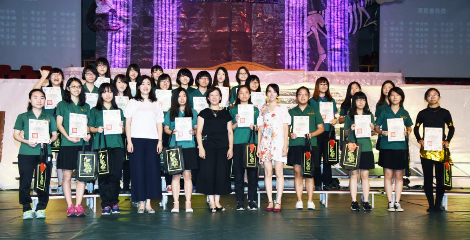
第75屆畢業典禮 - 頒發家長會會長獎