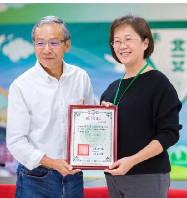
家長成長班精彩課程 - 台灣念真情的吳念真導演