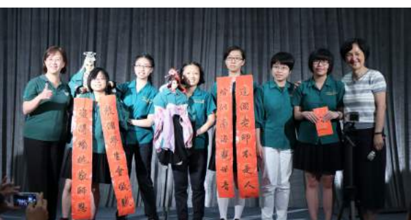
期末敬師餐會 - 小綠綠布袋戲社團表演