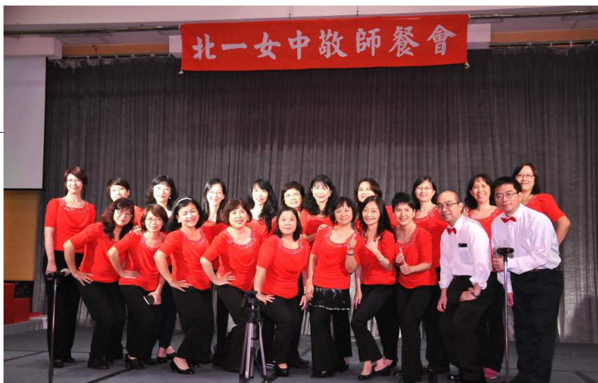
合唱團在敬師餐會中獻唱練習多日的歌曲

團員感情的維繫與凝聚是團隊經營不可或缺的因素。平常大家各自忙事業，每隔兩週才見一次面，但都來匆匆去匆匆只是上課而已，團員沒有多餘的時間互動交流，所以貼心的團隊幹部們會不定期的舉行聯誼活動。本期期末餐會上，見大家互相微笑、握手、擁抱，餐桌上笑容洋溢在每個人的臉上，團員彼此噓寒問暖，暢所欲言，藉由餐會聯誼串起大家更誠摯的友誼，讓團員們不是只有表面寒暄，而是在生活上可以相互分享，在生命中可以互相關懷，在音樂領域裡共同結緣，使「綠韻」成為一個和樂的大家庭。