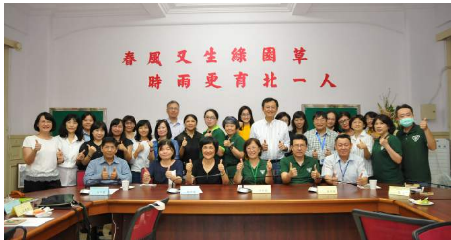
105 學年度北一女家長委員會期末會議合影