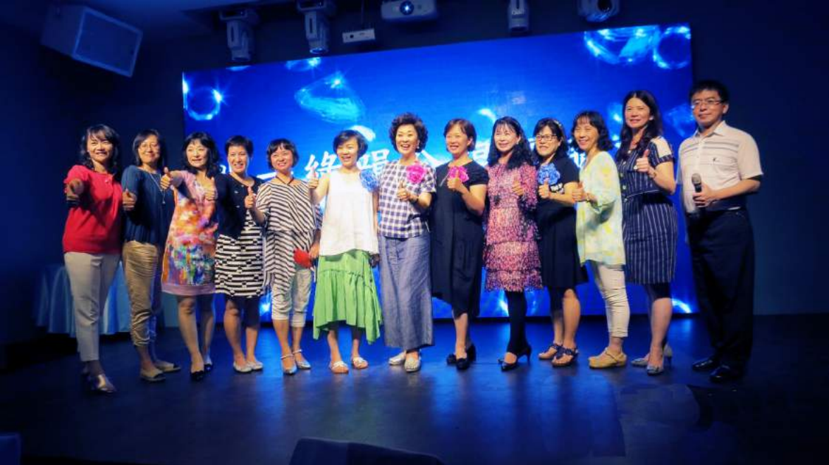
合唱團的聯誼餐會、緊密聯繫團員間的感情