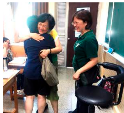
楊校長前往指考考場 為小綠綠加油、打氣