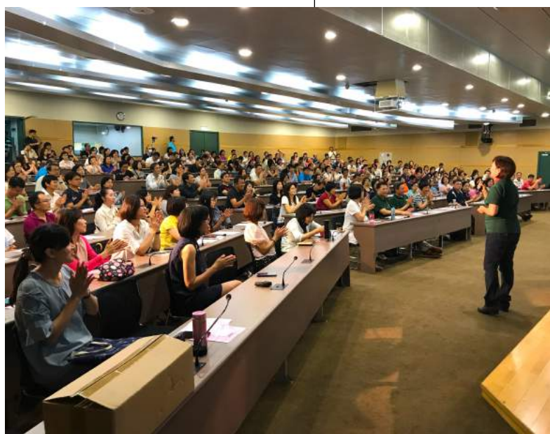
高一新生家長說明會

從校慶系列活動、校友三十重聚、學校日等等，都可以看到家長會志工的努力，廣召家長一起支持學校，讓老師們能為孩子規劃更好的學習環境，家長會每年也會製作精美實用的限量紀念品贈送給捐款人，拜託大家能多多慷慨解囊，作學校的最佳後盾。