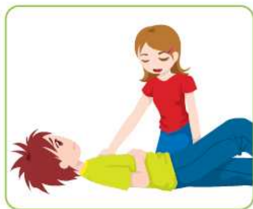
圖7-1 安撫傷者，能穩定其情緒

面對事故現場，多數人都會不知所措，但是只要秉持「對傷患最有利」的原則，保持冷靜，不做超出自己能力的行動，都能對傷患有所幫助（如圖7-1）。此外，傷患與家屬在面對突如其來的狀況時，有可能陷入恐慌，施救者若能明確說明情況與急救措施，注意維護傷患的隱私，就可有效安撫他們的情緒。對於有生命危險的事故傷者，除了盡全力施救，應盡可能陪伴在其身邊，而協助聯繫家屬也是必要的措施。